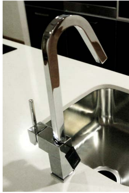
Grifería de cocina modelo KALA. Kitchen taps model KALA.