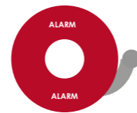
Preinstalación de alarma interior bajo la supervisión de C.R.A.C. 24 alarmas. Security alarm system pre-installations, provided by C.R.A.C. 24.