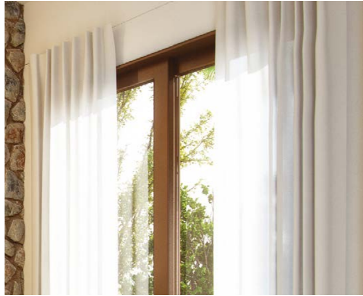
Carpintería exterior en aluminio marrón oscuro. Dark brown aluminium frames in the outdoor area of the house.