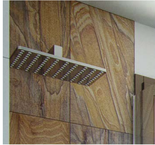
▲ Rociador a pared con monomando empotrado y maneta ducha. Built-in mixer tap wall sprinkler and shower lever.

Baño chapado con una combinación de elementos: porcelánico, cerámica y piedra natural. Tiling in the bathroom based on an combination of the following elements: porcelain, ceramic materials, and natural stone.