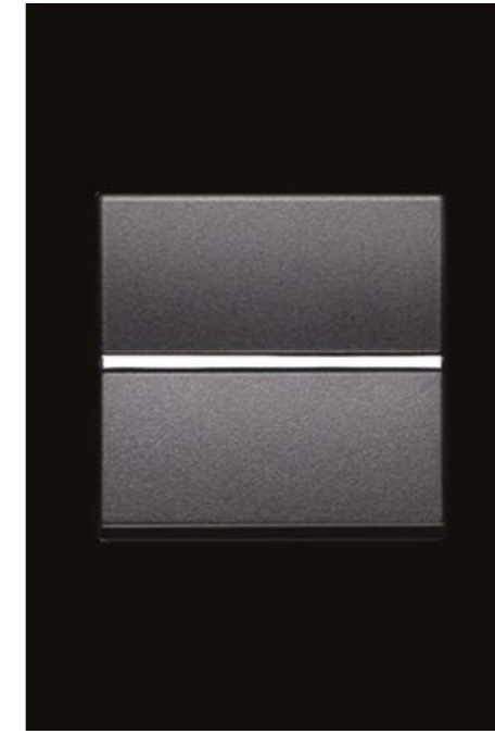
Mecanismos modelo ZENIT. Switches model ZENIT.