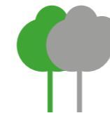
Edificio construido según normativa de eficiencia energética. Building constructed in accordance with the last energy efficiency standards.