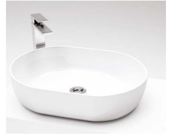
▲ Lavabo TOULOUSE - Lavamanos y grifería monomando con caño alto modelo despertar. TOULOUSE sink.- Washbasin and high pipe mixer taps "despertar" model.