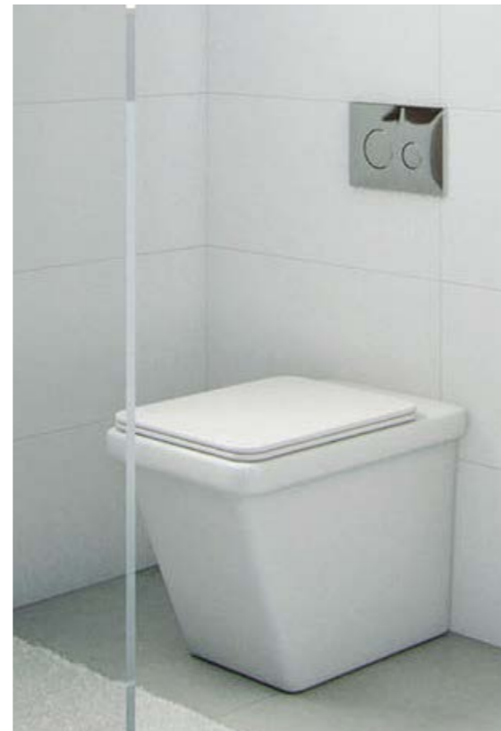
► Inodoro con cisterna empotrada. Built-in toilet tank.