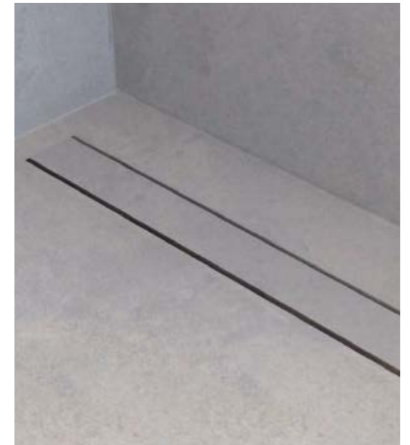
► Ducha integrada. Integrated Shower.